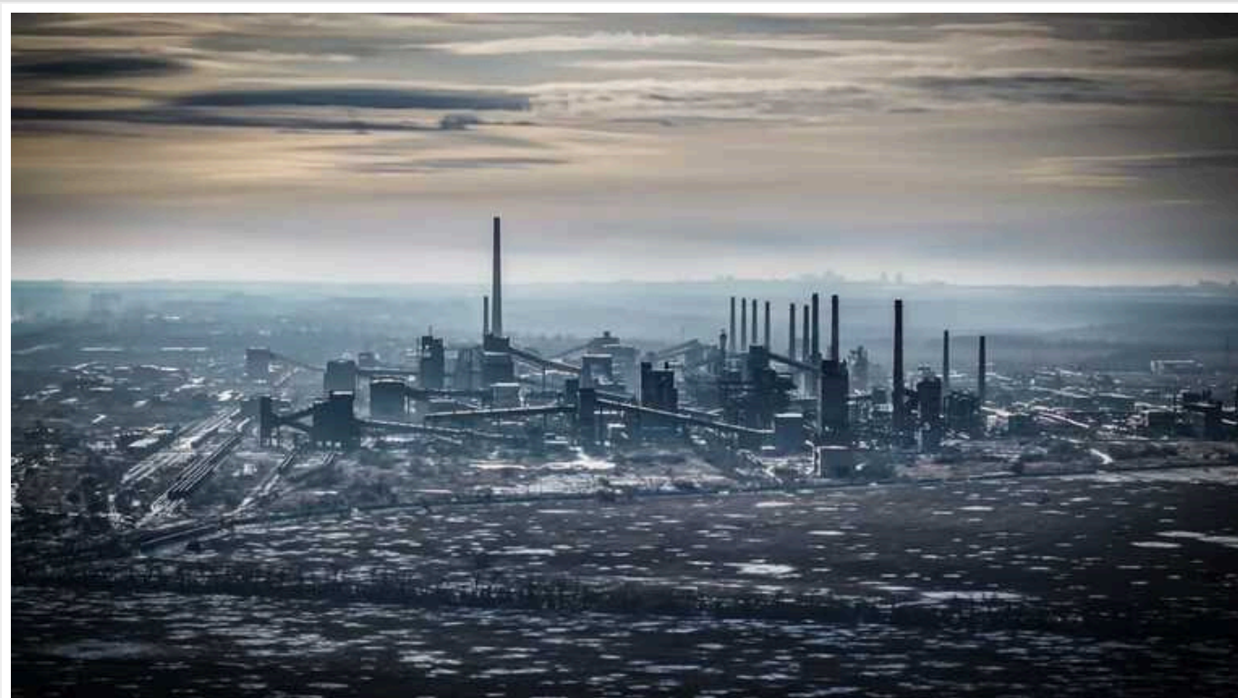
Бійці 47 ОМБр останніми вийшли з Авдіївського коксохіму після чотирьох місяців оборони

Бійці 25 окремого штурмового батальйону 47 окремої механізованої бригади останніми вийшли з Авдіївського коксохімічного заводу після чотирьох місяців оборони.