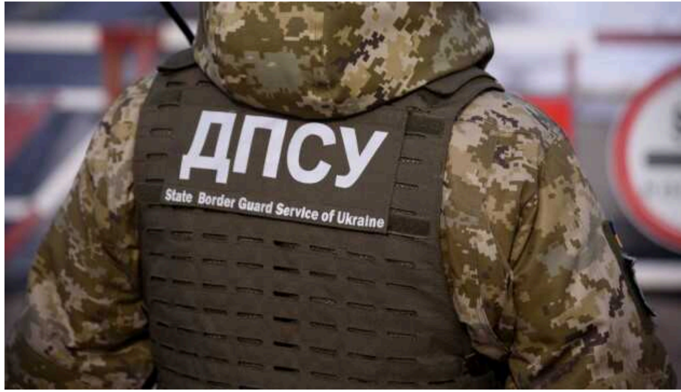
У ДПСУ назвали регіон з найбільшою активністю ворожих ДРГ

Російські окупанти використовують свої диверсійно-розвідувальні групи для заходу на нашу територію, щоб викривати місця перебування сил оборони, куди потім завдають удари. Такі ворожі ДРГ найбільш активні на Сумському напрямку.