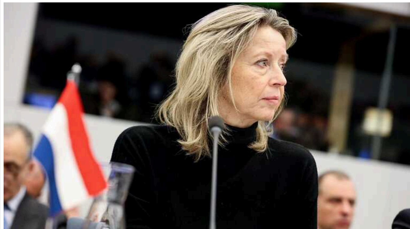
Нідерланди вже почали передавати Україні безпілотники в рамках коаліції дронів, - Міноборони