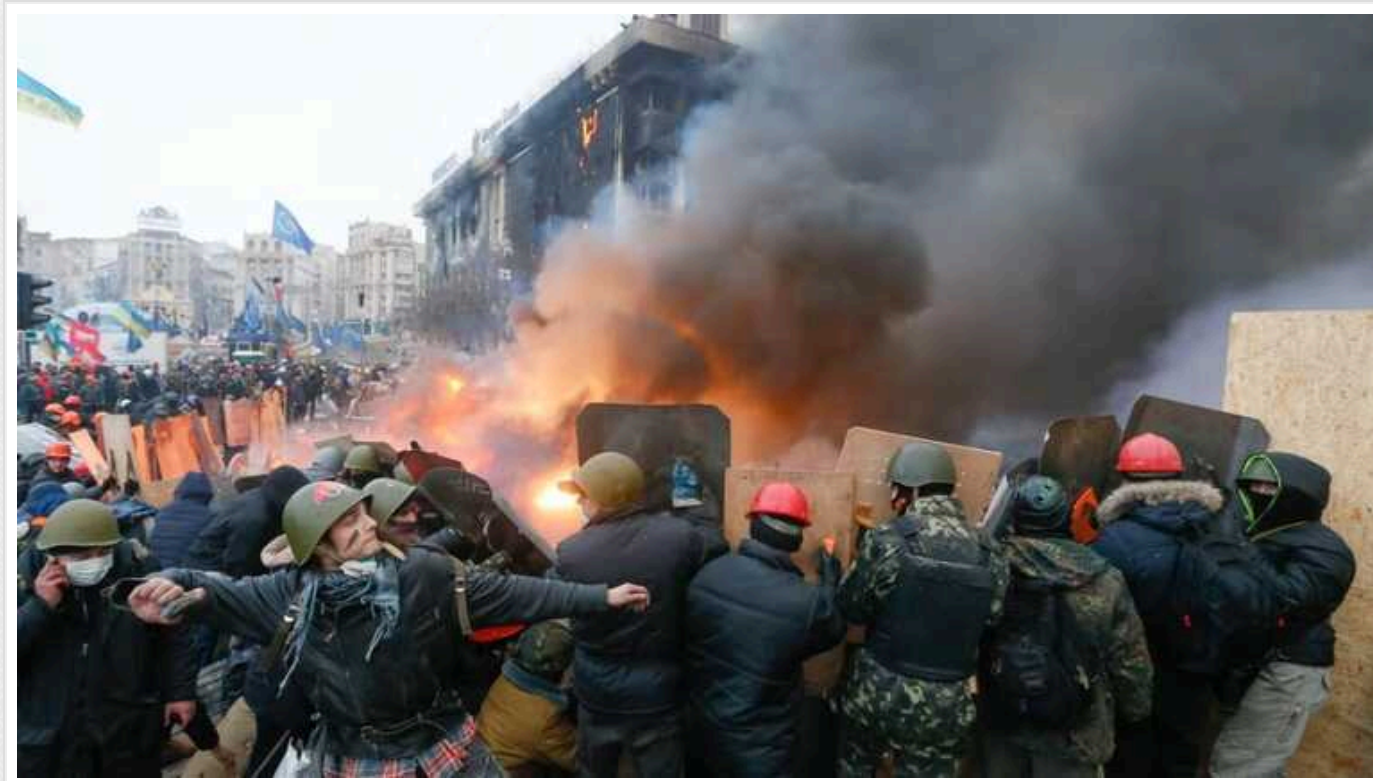
В Офісі генпрокурора розповіли, чи стріляли по учасниках Євромайдану російські снайпери: "РФ мала величезний вплив"

Під час подій на Майдані у 2013-2014 роках всі насильницькі дії та злочини, включно з вбивствами учасників Революції Гідності, виконували українські правоохоронні органи за вказівкою української влади та під впливом Росії. Доказів про присутність російських снайперів на Майдані немає.