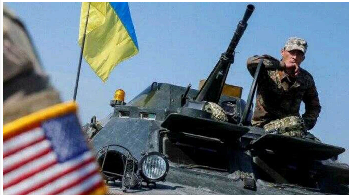
CNN: Армія США виділяє кошти на підтримку України з власного рахунку

Армія Сполучених Штатів Америки змушена самостійно оплачувати підтримку Сил оборони України, оскільки Конгрес досі не схвалив законопроект, в якому передбачено додаткове фінансування для Києва. Протягом останніх кількох місяців збройним силам Штатів довелося сплатити рахунки на сотні мільйонів доларів "на підтримку військових зусиль України".