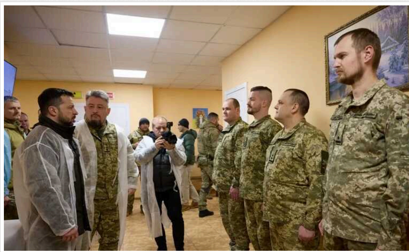
Зеленський відвідав у Харкові поранених українських захисників: "Я бажаю вам здоров'я та перемоги"

У понеділок, 19 лютого, президент України Володимир Зеленський відвідав у Харкові поранених українських захисників, які лікуються в одному із медичних закладів міста. Там гарант поспілкувався із воїнами та медиками, а також вручив їм державні нагороди.