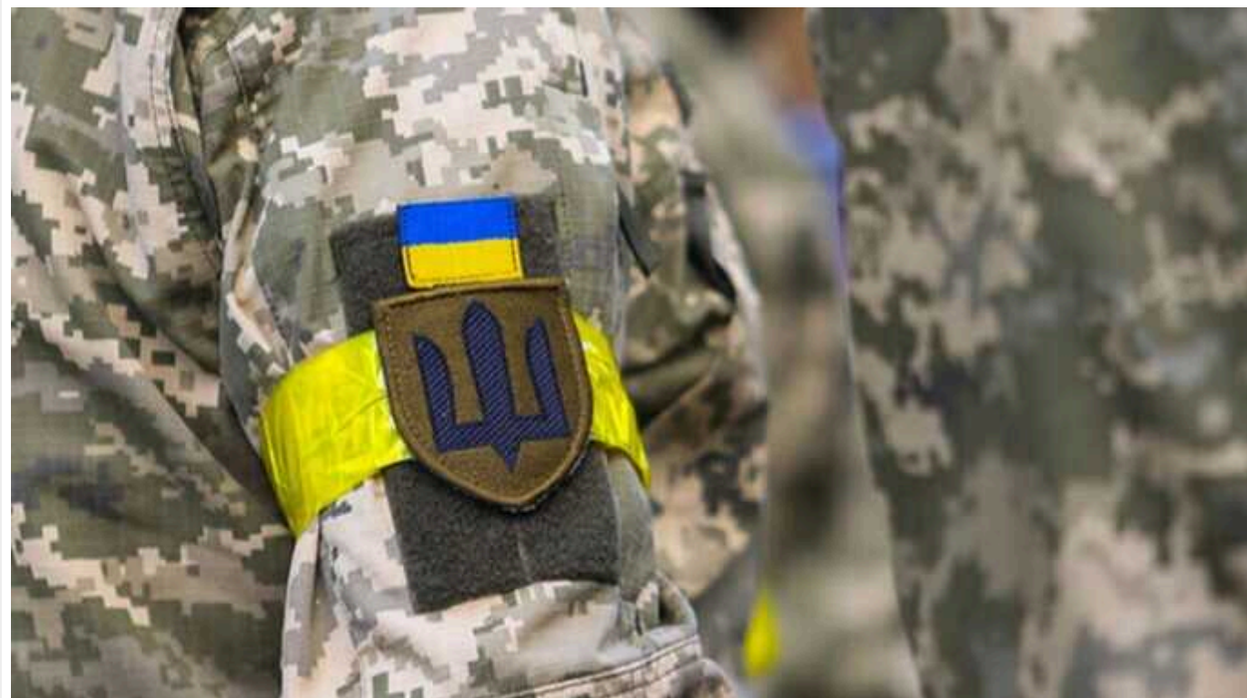
У ВР розповіли про основні правки до законопроекту про мобілізацію