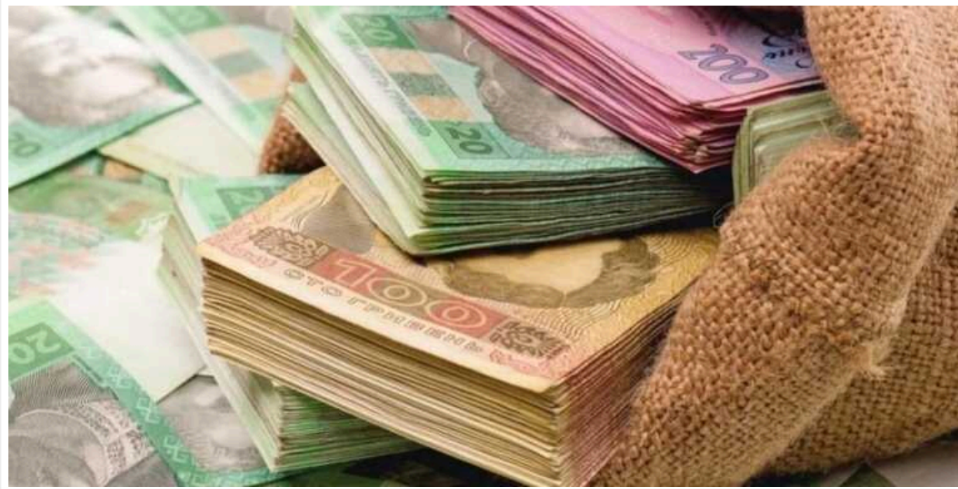
В Україні збільшилась кількість мільйонерів під час великої війни

У перший рік повномасштабної війни в Україні побільшало мільйонерів. За результатами декларування отриманих у 2022 році доходів, таких громадян стало більше на 16%, ніж було в 2021-му – або на 2863 особи.