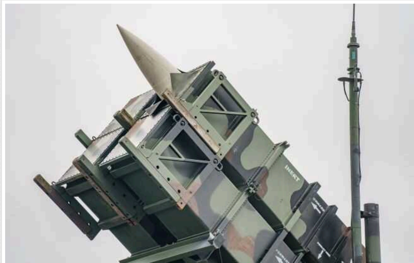
Військовий експерт Томас Тейнер: Подарована Німеччиною батарея Patriot збила вже 18 російських бортів

На рахунок однієї з переданих західними партнерами Україні батареї американського ЗРК Patriot уже 18 збитих російських літаків. Її нашим захисникам передала Німеччина.