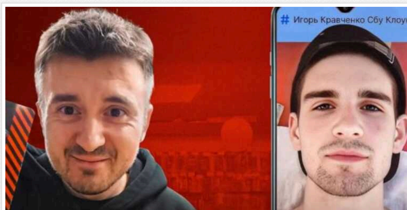
По слідах скандалу "СБУ проти бігусів": відправка «на фронт» як покарання?

Учасників безплатної спецоперації відправили «на фронт» як покарання. Як це виглядає для тих, хто захищає країну зі зброєю в руках, зголосившись добровільно, і тих, хто не ховався, не тікав, а прийшов по мобілізації? Не як заміна кримінальному покаранню, не замість перебування у СІЗО.