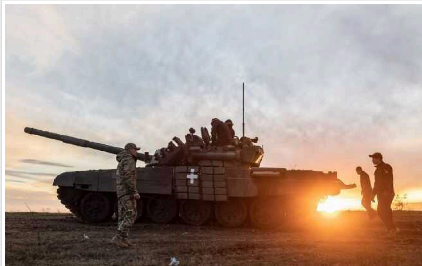
Newsweek: Після виходу ЗСУ з Авдіївки в Китаї заявили про "ненадійний" Захід

За словами китайського ультра націоналістичного оглядача Ху Цзіня, підтримка Заходу виглядає ненадійною, що послабило довіру та довгострокові очікування Києва та, у свою чергу, підвищило моральний дух у РФ.