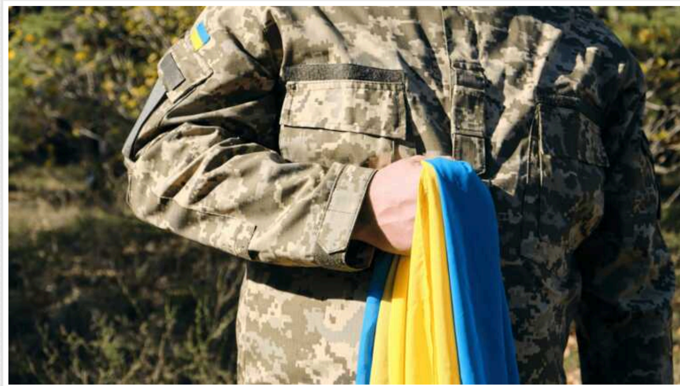
На Закарпатті чоловік ухилився від мобілізації, але задонатив 40 тисяч гривень на ЗСУ

У Закарпатській області до іспитового терміну відбування покарання засудили чоловіка, який ухилився від мобілізації. На суді він заявив, що категорично не хоче служити в армії.