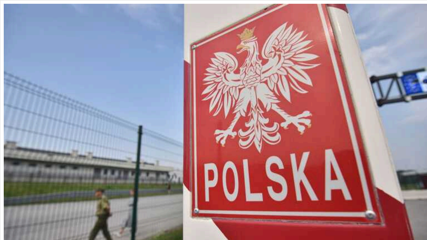
РФ може використати блокаду поляками автобусів на кордоні з Україною у своїх інтересах – Мінінфраструктури

Блокювання транспорту – зокрема, автобусів із пасажирами – на польському кордоні матиме тяжкі соціально-політичні наслідки для обох країн. Ба більше, це є прямою загрозою безпеці країни, що обороняється.