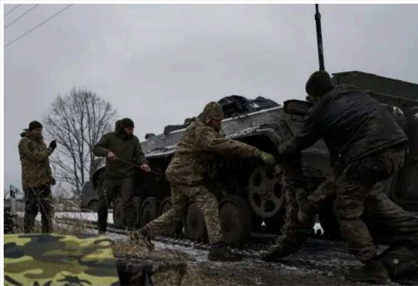
Покровськ, Часів Яр чи Роботине: куди РФ націлить сили після захоплення Авдіївки

Авдіївка була важливим опорним пунктом ЗСУ, але перевага у вогневій потужності й людських ресурсах дозволили РФ окупувати місто. Тепер ворогу належить вирішити, куди перевести основні сили. Опитані Фокусом військові аналітики впевнені, що найближчим часом атаки посиляться як на Лимано-Куп'янському напрямку, так і на півдні Запорізької області.