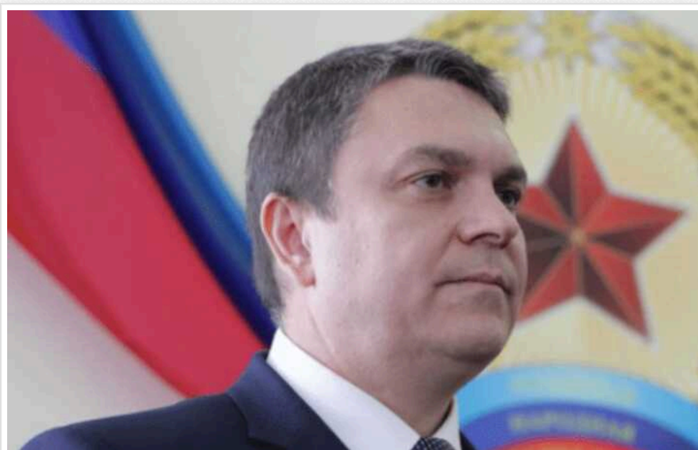
Російська влада звинувачує Україну в отруєнні голови "ЛНР" Пасічника

Російська влада звинувачує Україну в використанні отруйних речовин для скоєння "терактів" проти представників окупаційної влади. Звинувачення планують представити у Гаазі.