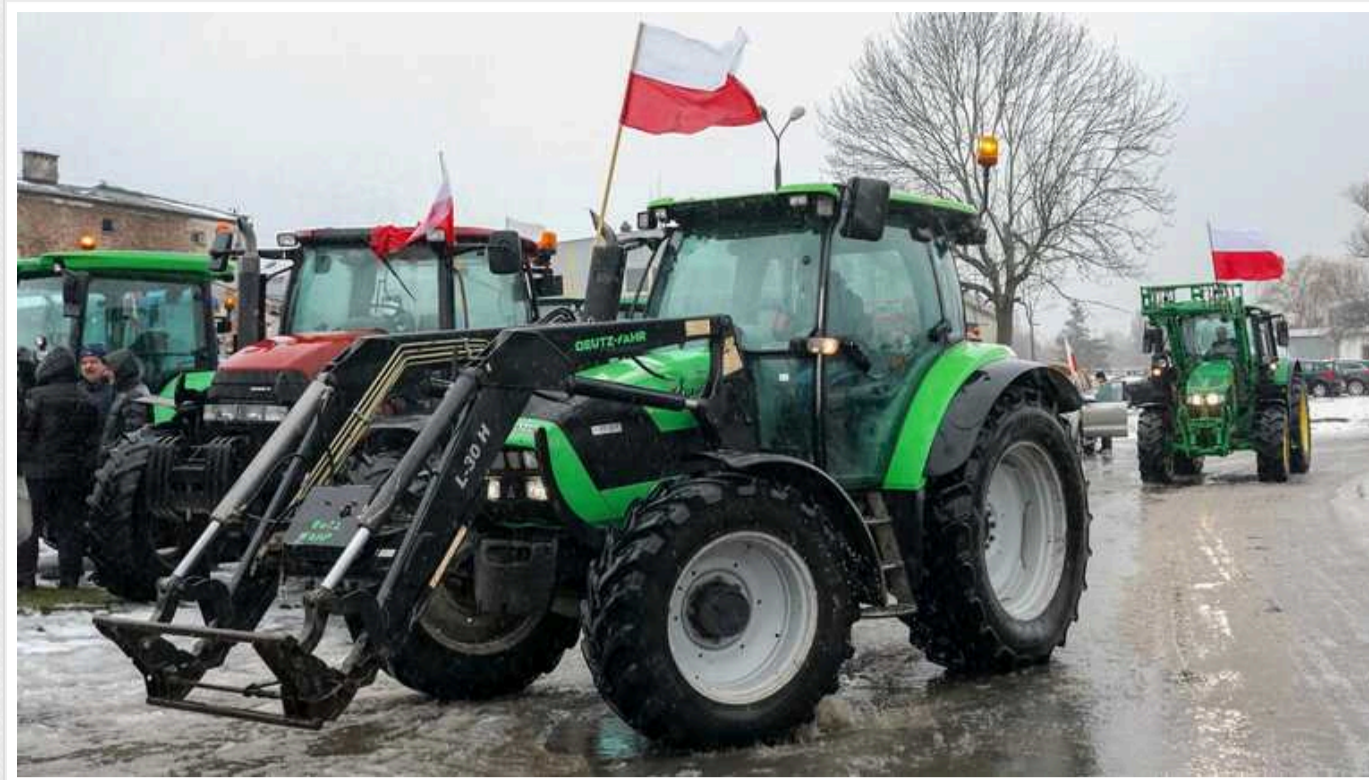
Польські фермери мають намір завтра повністю заблокувати кордон із Україною

“Будуть заблоковані не лише прикордонні переходи, а й вузли зв’язку та під’їзні шляхи до перевалочних залізничних станцій та морських портів”, - йдеться в їхніх повідомленнях.