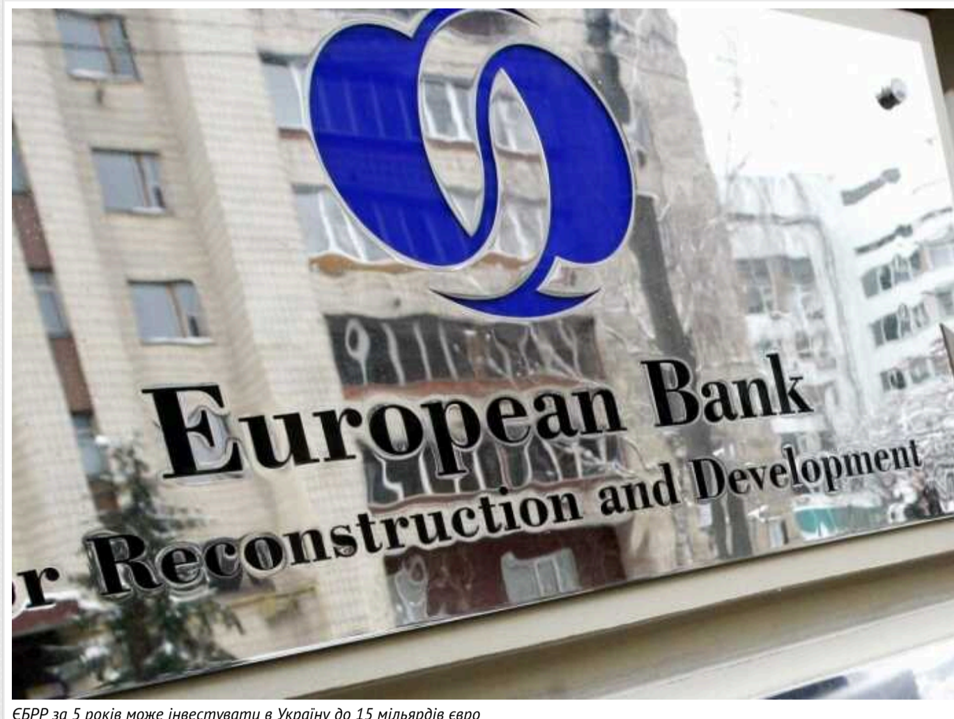
ЄБРР за 5 років може інвестувати в Україну до 15 мільярдів євро

Від початку повномасштабного вторгнення Росії в Україну Європейський банк реконструкції та розвитку інвестував в економіку України 3,8 млрд євро. У найближчі п'ять років ЄБРР може інвестувати в Україну від 7,5 млрд до 15 млрд євро.