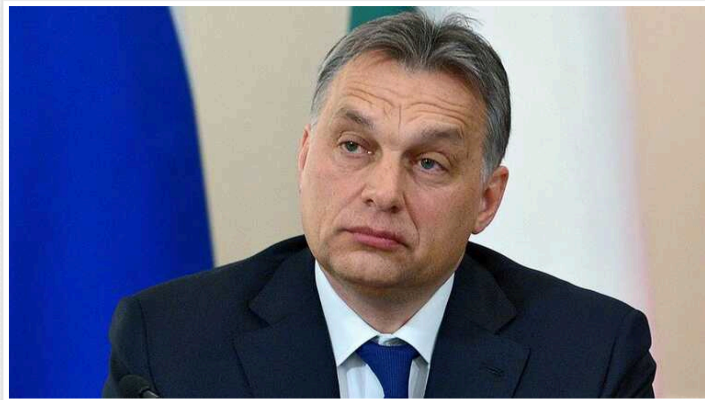
Віктор Орбан виступив за закриття європейського ринку для української агропродукції

Прем'єр-міністр Угорщини Віктор Орбан виступив за закриття європейського ринку для української агропродукції.