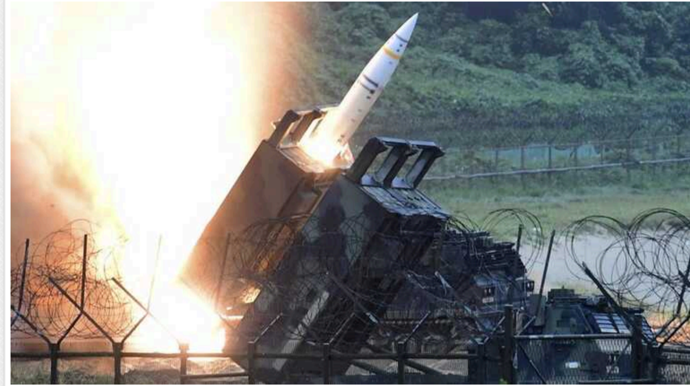
Білий дім може попросити союзників передати Україні ракети ATACMS дальністю понад 300 кілометрів, - NBC News

Україна минулого року здобула старі версії цих ракет середньої дальності.