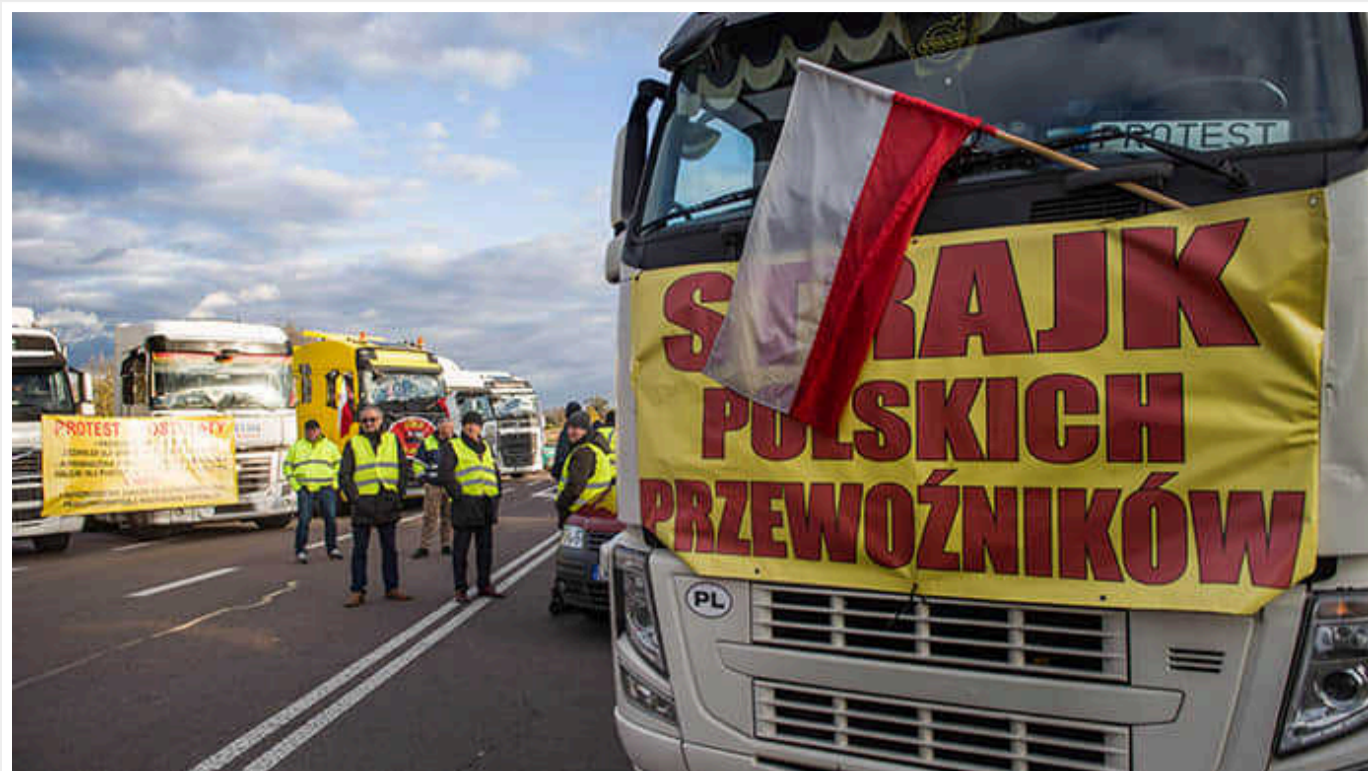
Польські фермери готуються повністю перекрити кордон України

Поляки наразі продовжують блокувати 6 із 9 пунктів пропуску на кордоні з Україною. Фермери хочуть перекрити не лише авто, а й залізницю і під'їзди до морських портів. При цьому від польських прикордонників Держприкордонслужба не отримувала ніяких офіційних повідомлень.