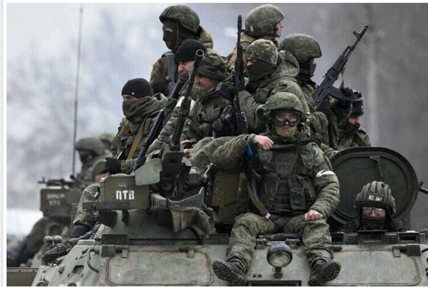
На окуповані території України прибули спецзагони з Кремля

Кремль відрядив на тимчасово окуповані території України спеціально підготовлені загони, які "малюватимуть картинку" для російського диктатора Володимира Путіна. Зокрема, вони куруватимуть фальсифікації та стежитимуть за роботою виборчих комісій під час так званих "виборів президента" РФ.