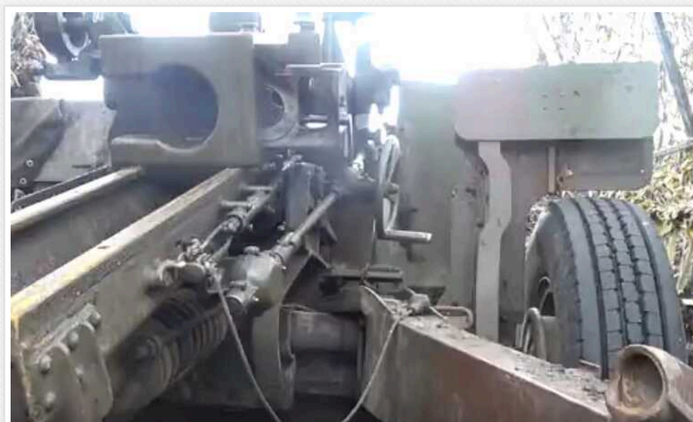
Єгері-десантники точними ударами знищили базу загарбників

Українські єгері-десантники нещодавно знищили військову базу окупантів. Захисники кількома точними ударами перетворили на попіл ворожу техніку, а також завдали ворогу втрат у живій силі.