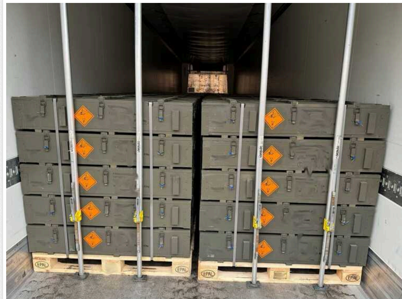
Озброєння для ЗСУ: «Українська бронетехніка» нарощує постачання 122 мм осколково-фугасних артилерійських пострілів

«Українська бронетехніка» нарощує постачання 122 мм осколково-фугасних артилерійських пострілів - сьогодні доставлено тисячі нових пострілів.