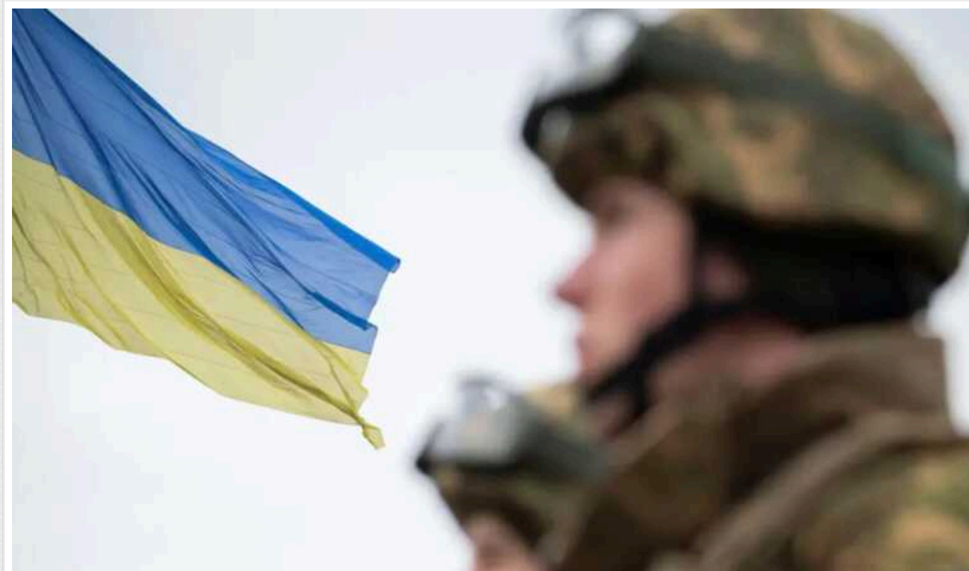
Військовослужбовець ЗСУ попереджає про можливий розворот РФ на Горлівський напрямок

В українських пабліках з'явилось попередження військовослужбовця ЗСУ Євлева, що окупанти можуть розвернутися на Горлівський напрямок.