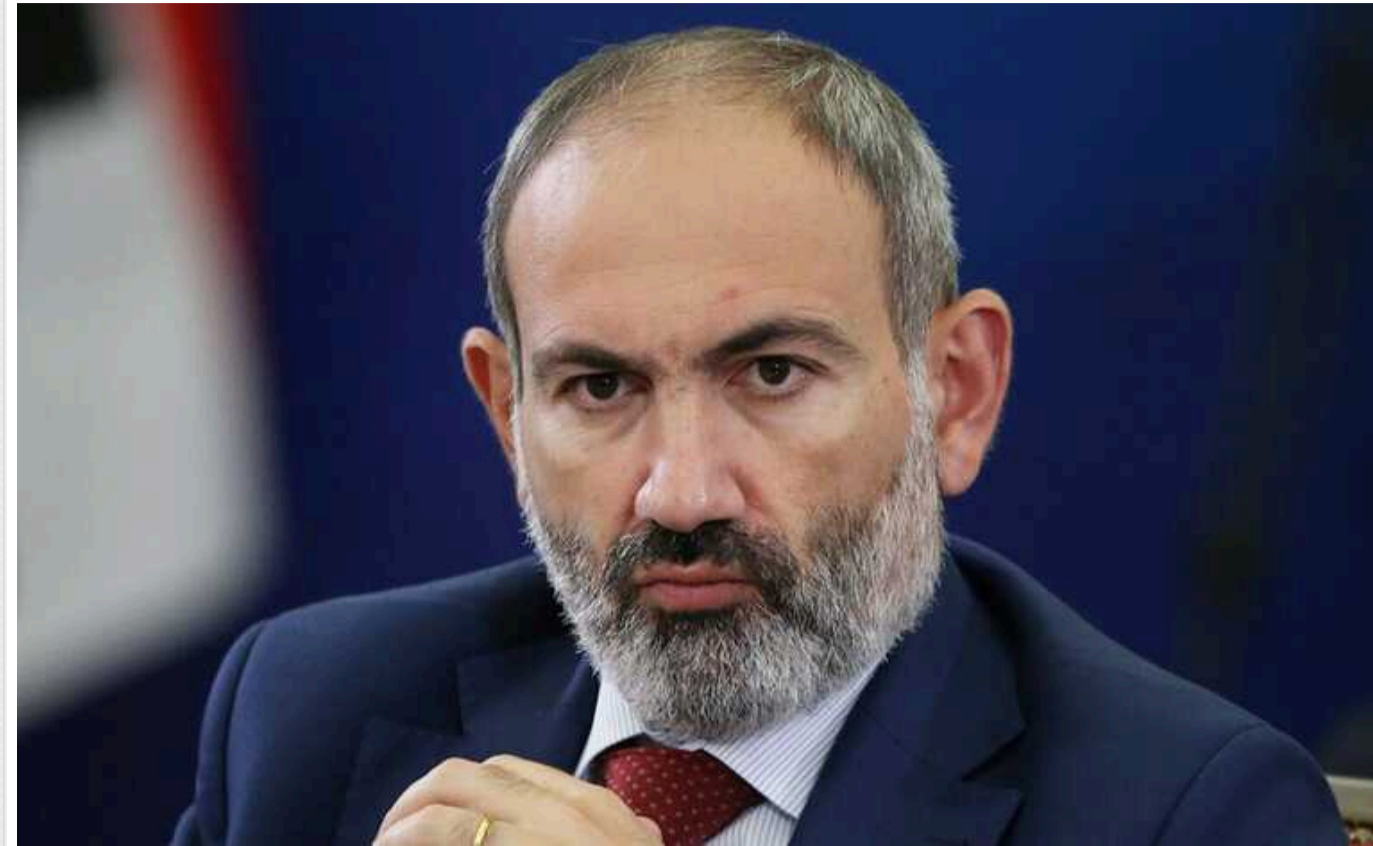
"Вірменія – не союзник Росії в її агресії, народ України – дружній нам", - Пашинян

Вірменський прем'єр-міністр Нікол Пашинян повторив, що його країна не є союзником РФ в її війні проти України.