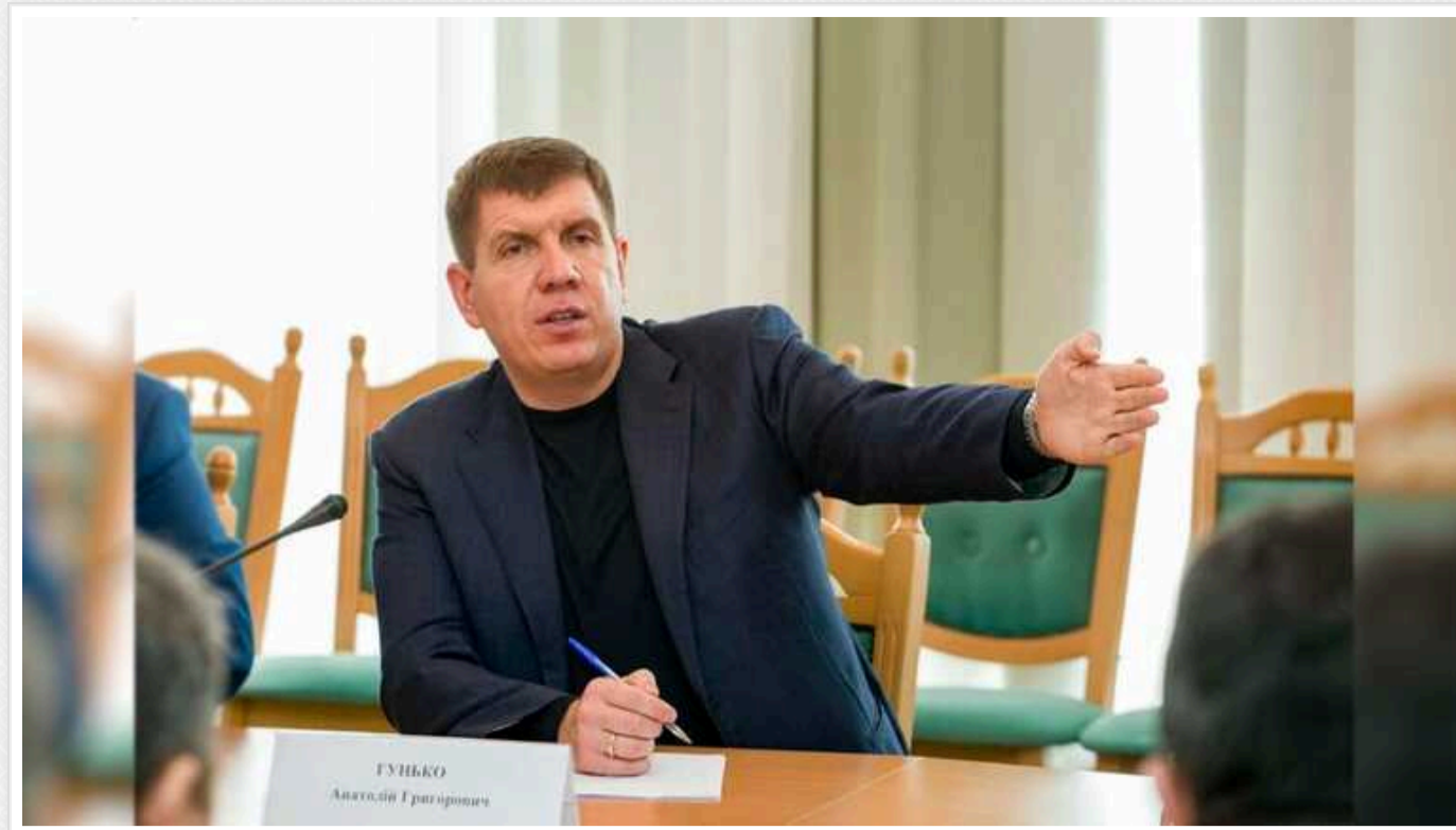
До суду передано справу нардепа від "Слуги народу" Гунька

Його підозрюють в отриманні 85 тис. дол. хабара.