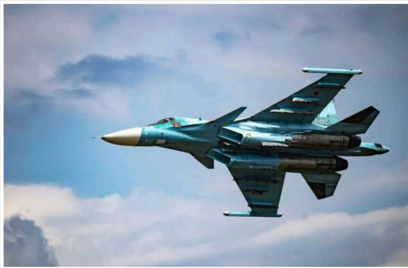
ЗСУ збили ворожі СУ-34 та СУ-35С, – Головнокомандувач ЗСУ