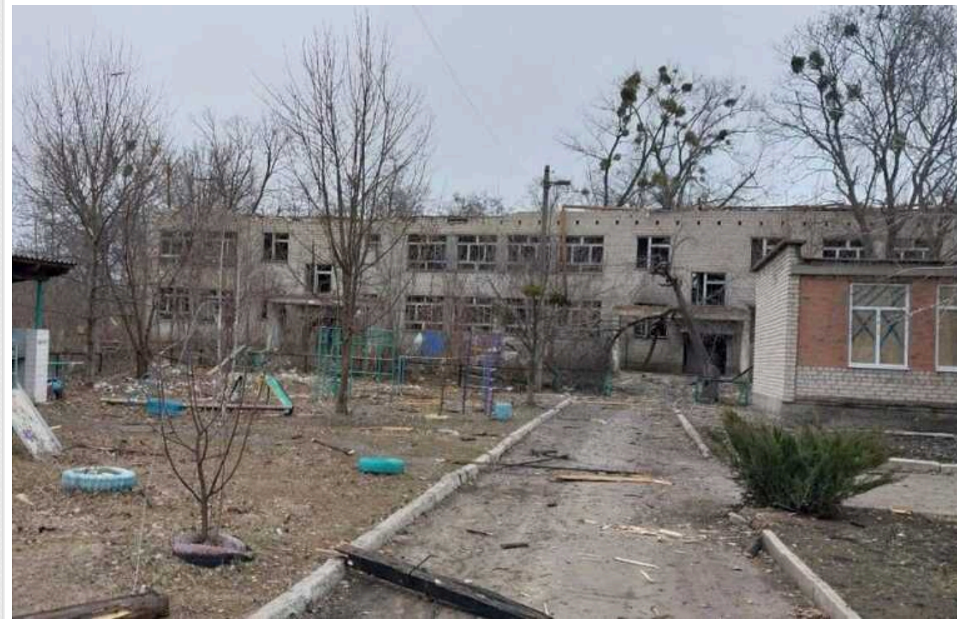
У Харківській області під час обстрілу загинув енергетик

У Куп'янському районі Харківської області під час обстрілу пошкоджено будівлю районних електричних мереж, знеструмлено підстанцію, загинув працівник Куп'янського районного відділення енергозбуту ПАТ "Харківобленерго".