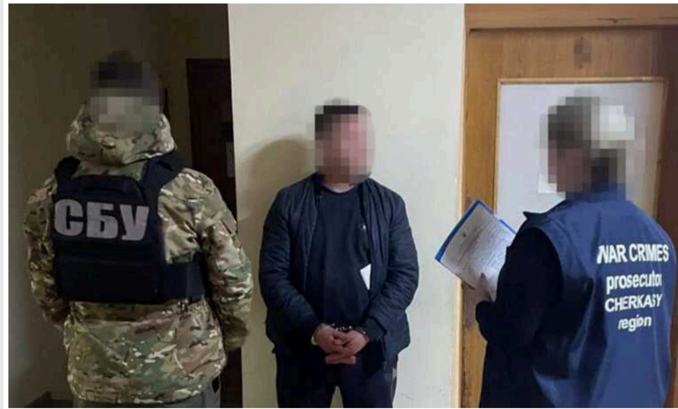
СБУ затримала агента російської розвідки, який готував ракетний удар по залізницях та військових шпиталях на Черкащині

За даними слідства – це 45-річний уродженець Луганщини, який у квітні 2022 року переїхав на Черкащину як переселенець.