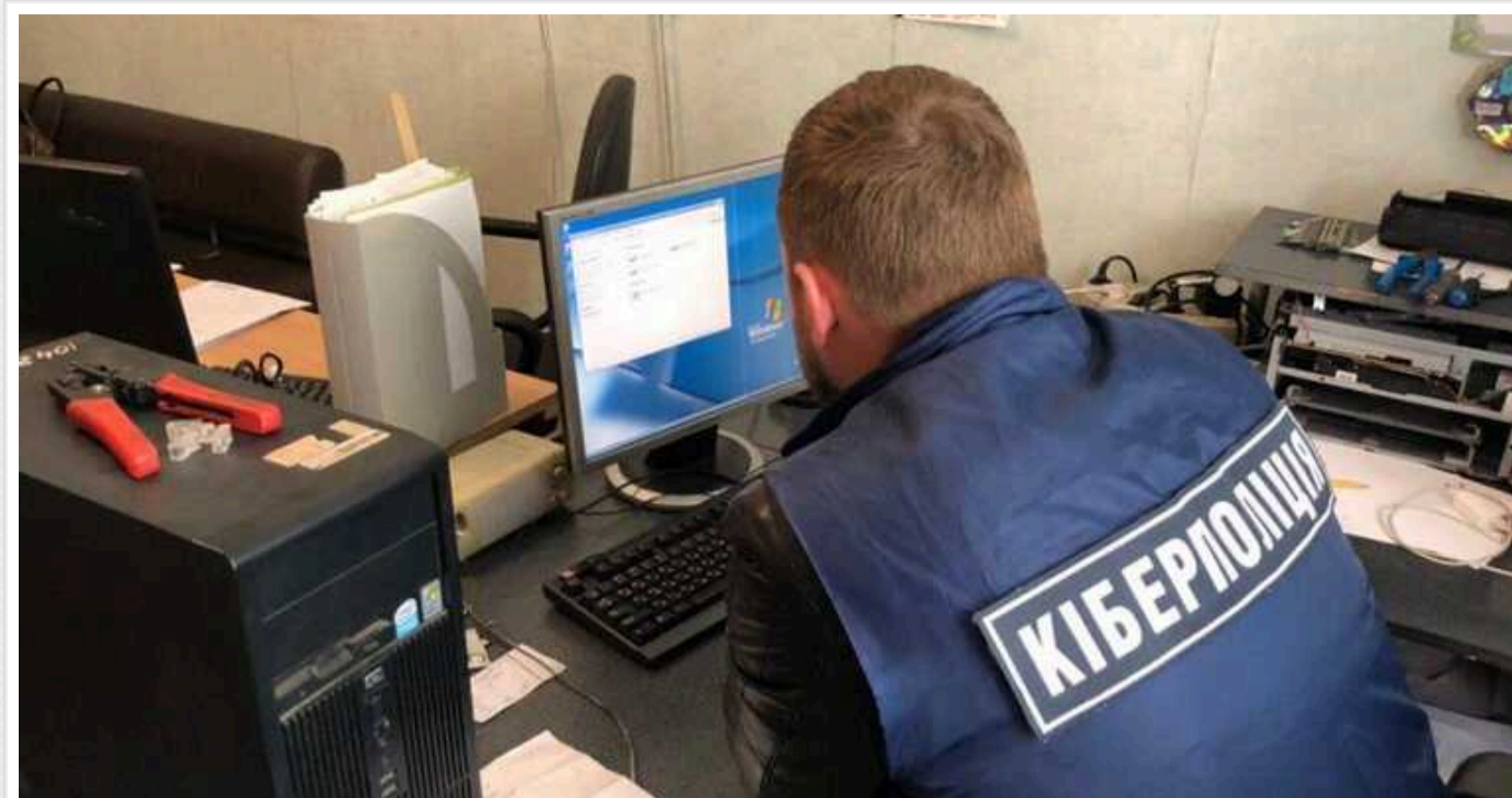
Кіберполіція попередила про новий вид шахрайства

Зловмисники розсилають фейкові СМС про посилки від імені відомого поштового сервісу, а всередині – фішингові посилання.