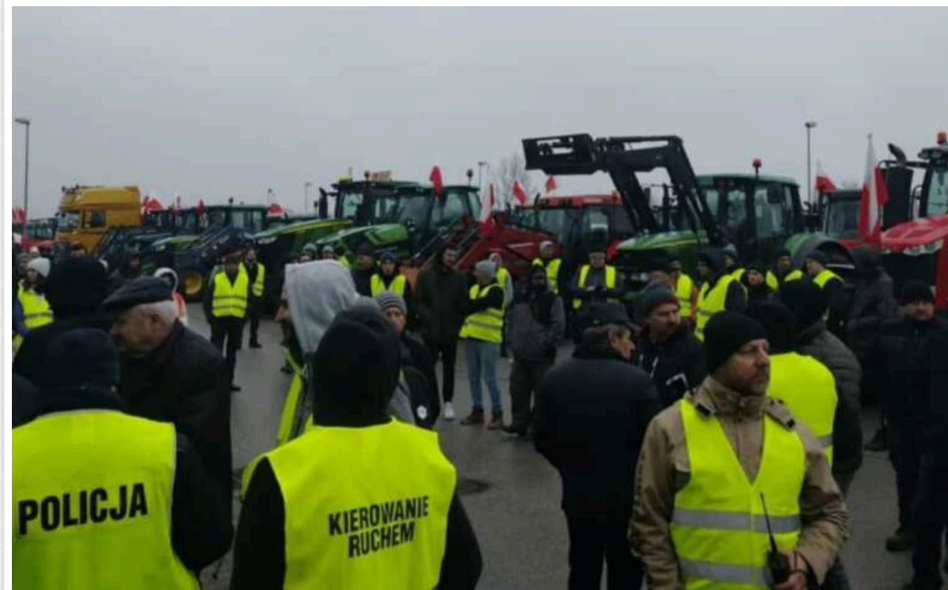
Мінвідновлення провело термінові переговори з Польщею через блокування пасажирського транспорту на кордоні

Віцепрем'єр з відновлення – міністр розвитку громад, територій та інфраструктури Олександр Кубраков провів термінові перемовини з головою Бюро нацбезпеки Польщі Яцеком Северой через блокаду польськими протестувальникам, зокрема, пасажирського транспорту.