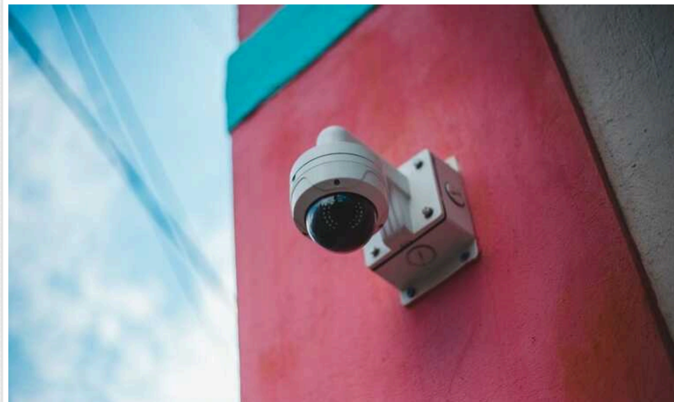
Окупанти вестимуть відеоспостереження за «виборами» на окупованих територіях

У Росії мають намір під час виборів президента Росії 15-17 березня вести відеоспостереження в дільничних виборчих комісіях на окупованих територіях України.