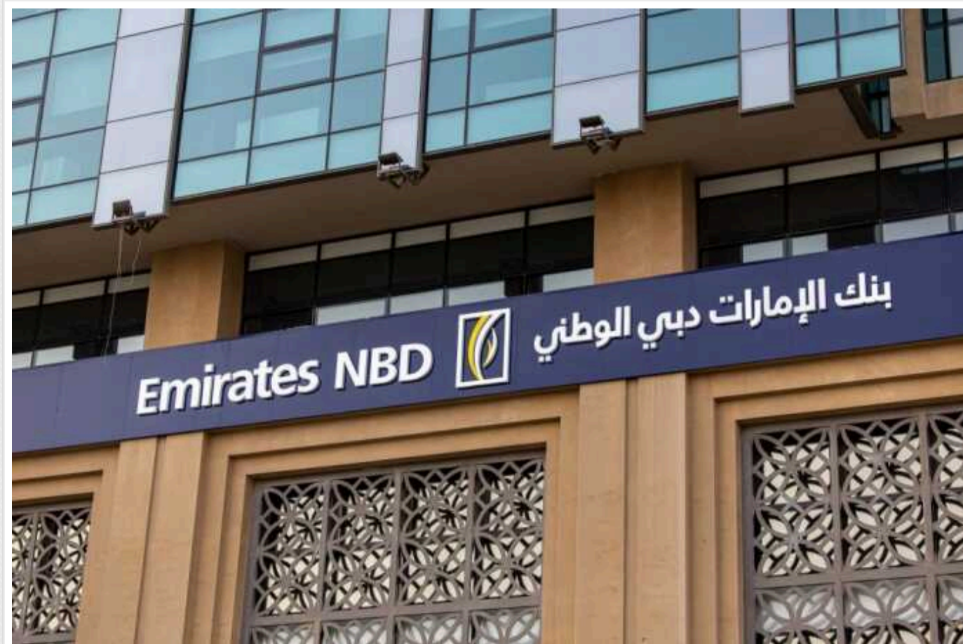
Банки ОАЕ обмежили розрахунки з Росією та почали закривати рахунки росіян, – ЗМІ

Банки Об'єднаних Арабських Еміратів (ОАЕ) через ризик вторинних санкцій обмежили розрахунки з Росією і почали закривати рахунки компаніям і фізособам.