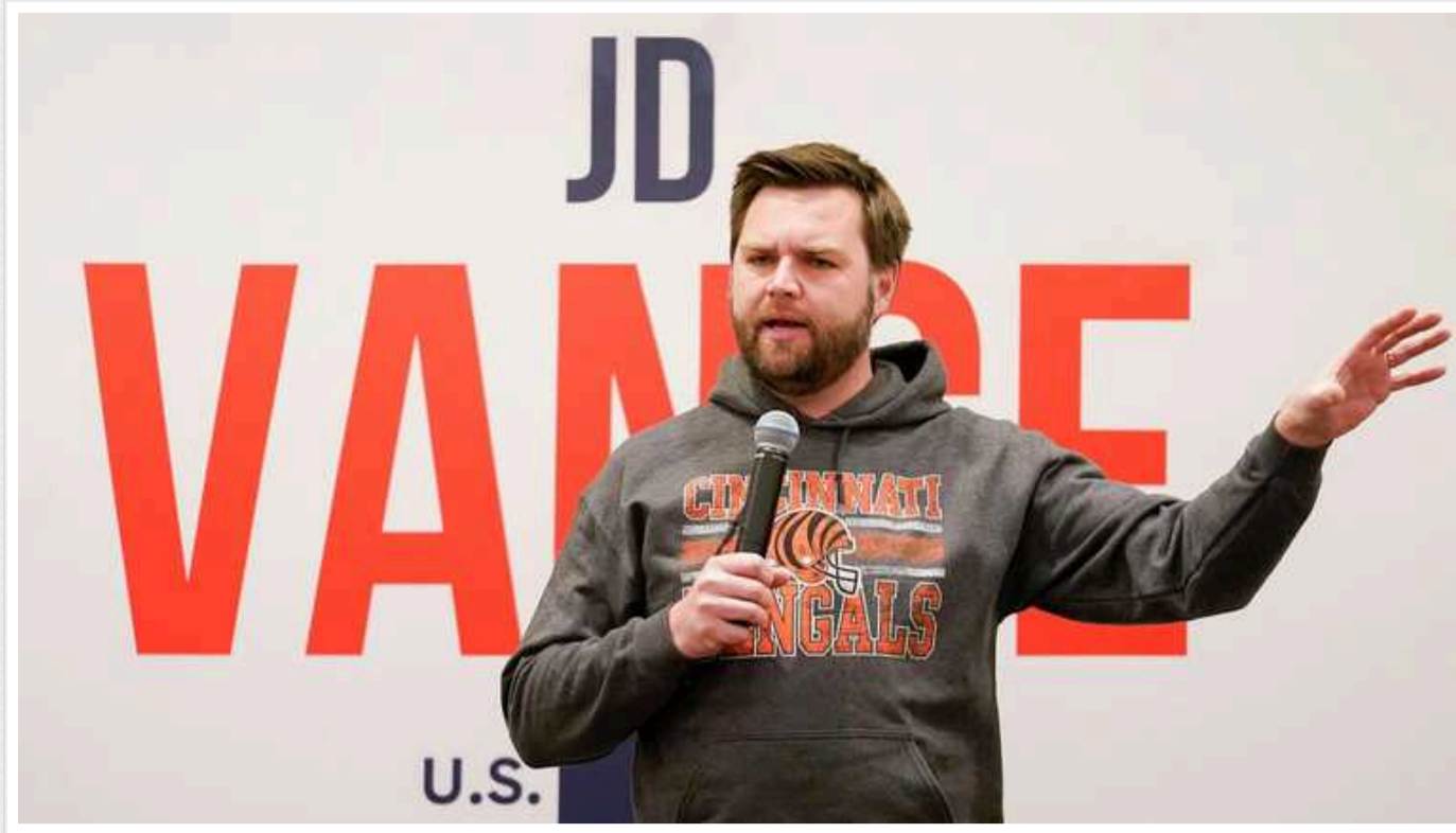
Американський сенатор Венс переконаний, що Трамп не відмовиться від НАТО

Сенатор-республіканець Джей Ді Венс запевнив європейських союзників, що навіть у разі можливого повернення Дональда Трампа на посаду президента вони зможуть розраховувати на підтримку США.