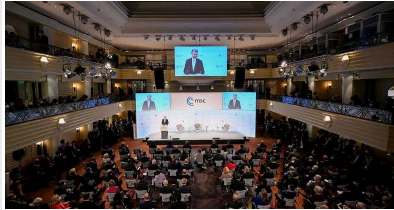
Financial Times: «Перемоги Росії похитнули віру світових лідерів у перспективі війни в Україні»

Видання Financial Times за підсумками Мюнхенської конференції з безпеки пише, що "перемоги Росії похитнули віру світових лідерів у перспективі війни в Україні".