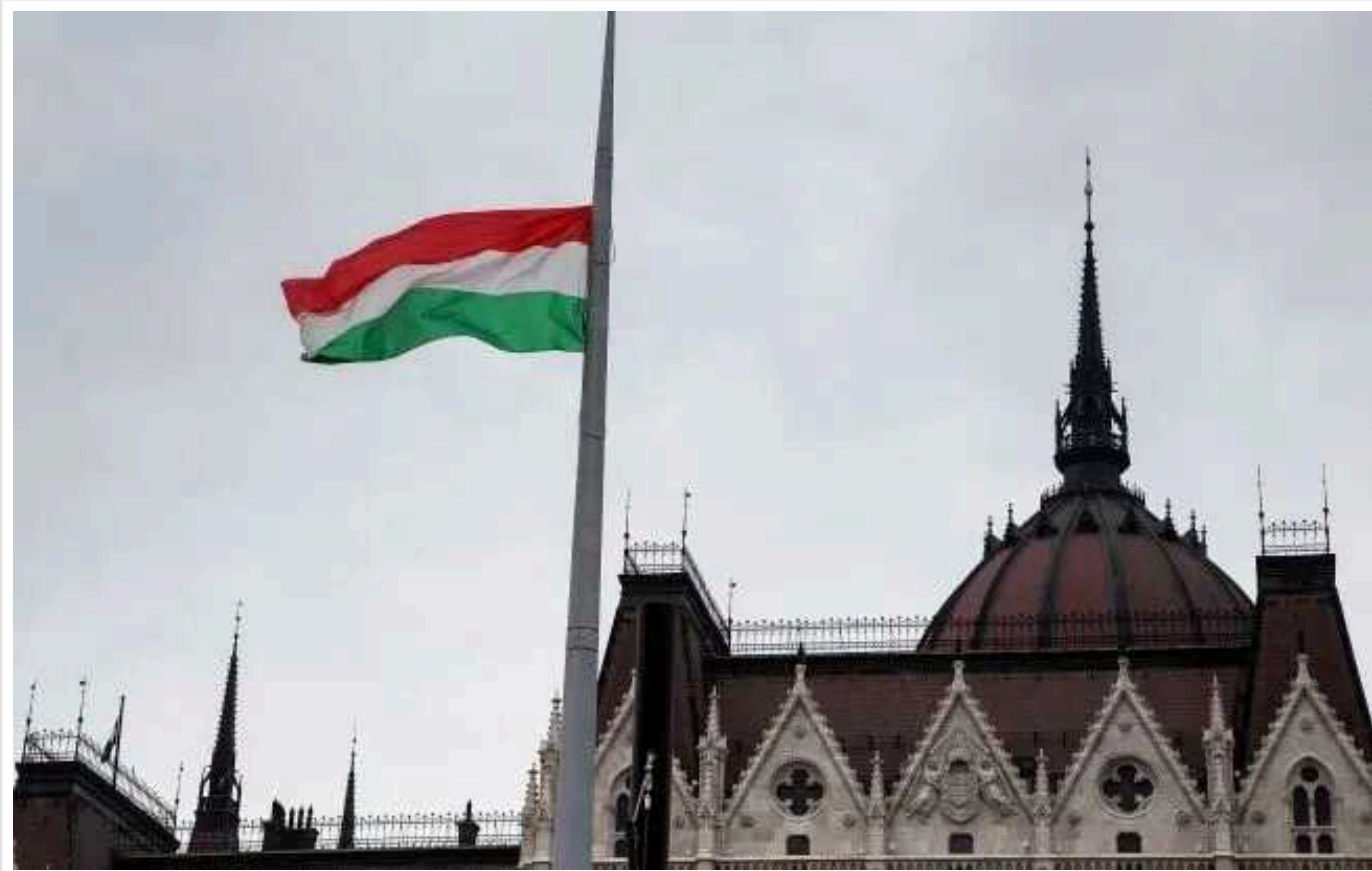
Угорський уряд не прийняв делегацію сенаторів США, яка приїхала у Будапешт на зустріч з ним

Двопартійна делегація американських сенаторів прибула з офіційним візитом до столиці Угорщини в неділю, щоб закликати уряд країни негайно схвалити заяву Швеції на вступ до НАТО, проте урядовці відмовилися зустрічатися з сенаторами.