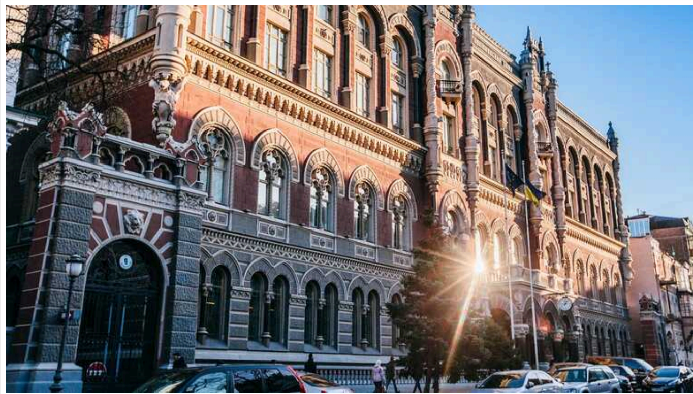
«Альпарі Банк» вирішив піти з банківського ринку

Єдиний акціонер АТ «Альпарі Банк» прийняв рішення № 6/2023 припинити здійснення банківської діяльності без припинення юридичної особи та затвердити відповідний план припинення.