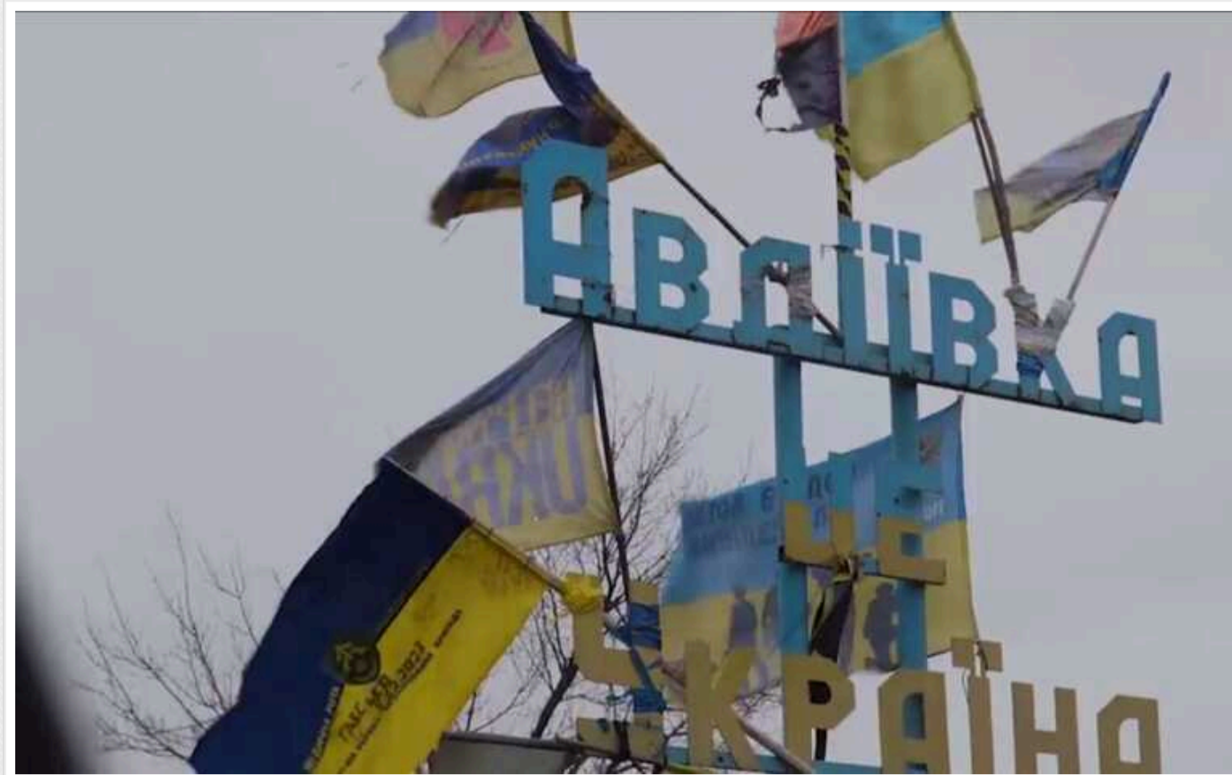
Рідні упізнали розстріляних окупантами полонених бійців ЗСУ в Авдіївці

Окупанти вбили шістьох полонених українських воїнів на території колишньої військової частини «Зеніт».