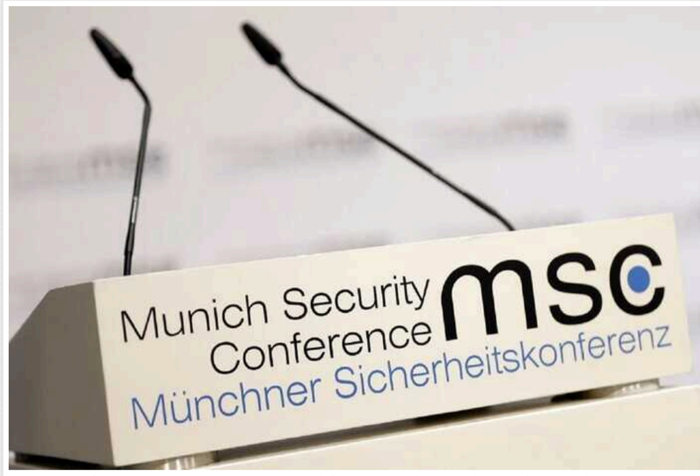
Bloomberg про безпекову конференцію в Мюнхені: Члени НАТО говорять про дуже вірогідний напад Росії на одного з них

За даними Bloomberg, на Мюнхенській безпековій конференції представники країн-членів НАТО в приватних розмовах обговорювали необхідність підготовки до можливого нападу Росії на одну з них на тлі сумнівів у ролі США в захисті Європи.