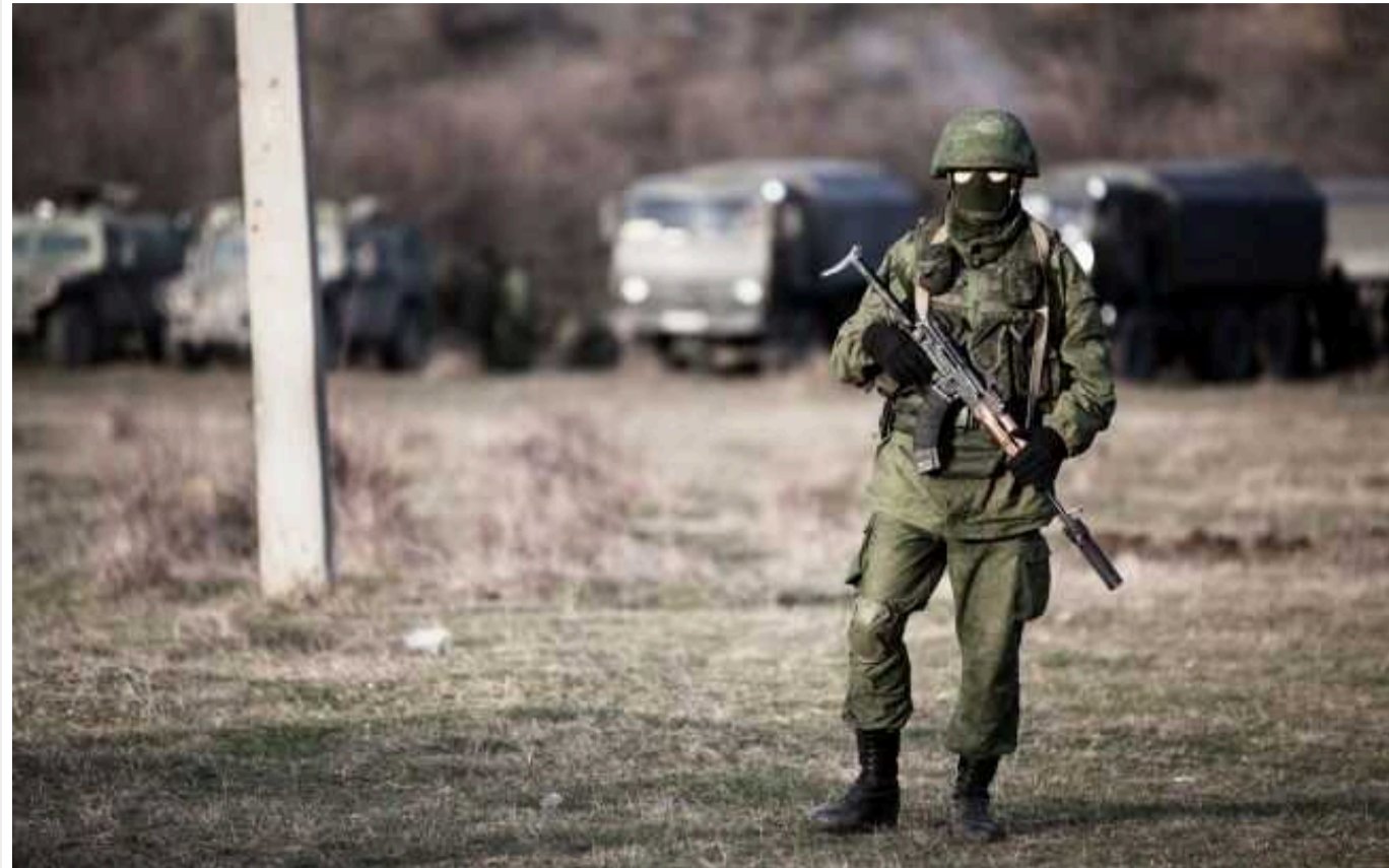
ЦНС: Мобілізовані башкири намагаються уникати прямої участі у боях

Жителі Республіки Башкортостан, яких країна-агресор відправила на загарбницьку війну в Україну, намагаються уникати прямої участі у бойових діях. Через це окупанти-росіяни вже неодноразово мали конфлікти із представниками татарських національностей.