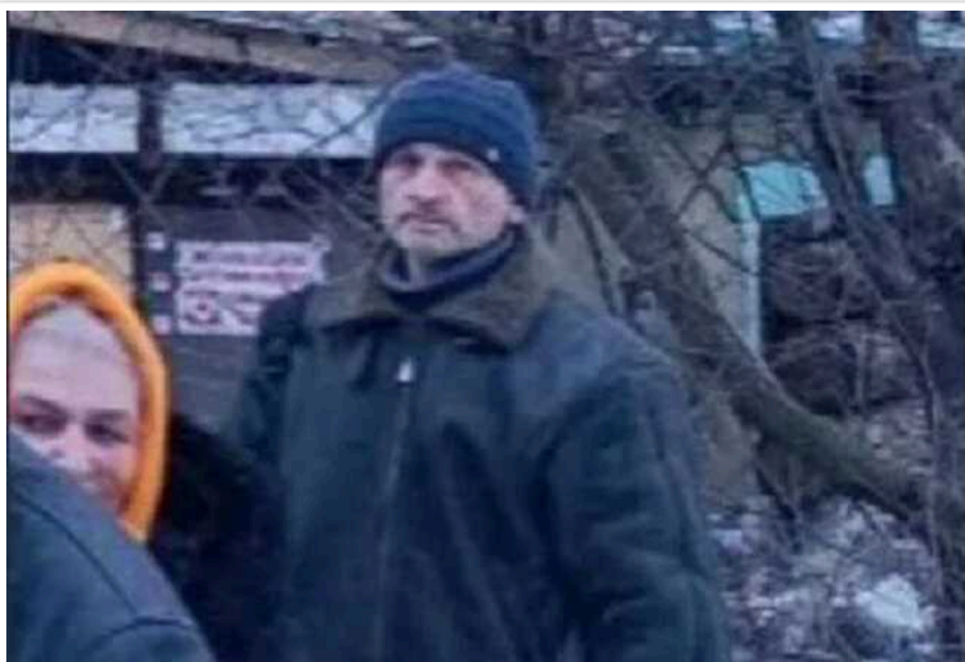
Колаборант з Авдіївки подякував РФ за знищення міста: у Мережі сплив компромат на нього

Російські пропагандисти зняли на відео місцевого колаборанта у тимчасово захопленій Авдіївці. Зрадник України на тлі повністю зруйнованого міста, де немає жодного вцілілого будинку, каже, що тепер "відчуває свободу".