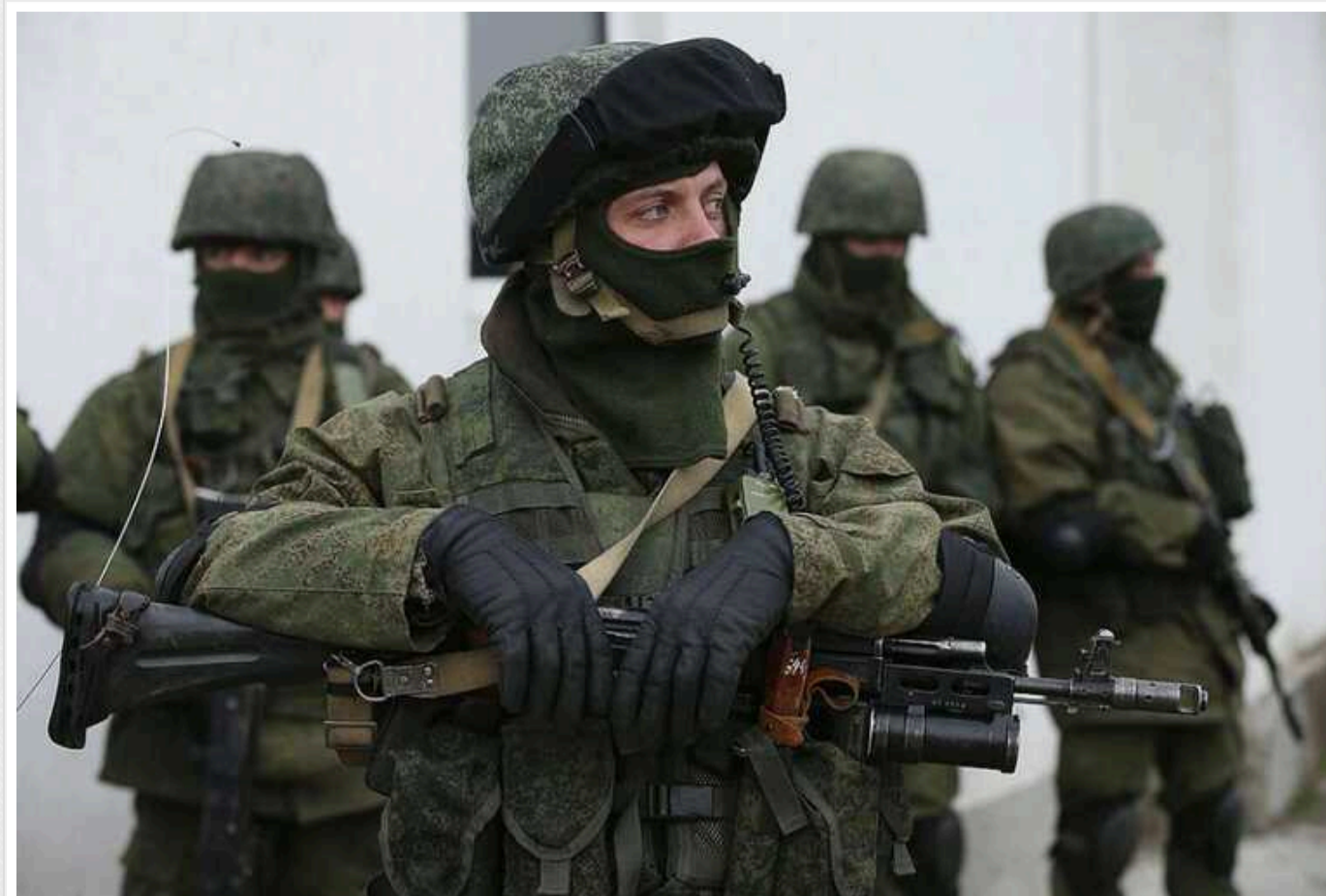
"Хай буде проклята ця Авдіївка": російські окупанти поскаржилися на величезні втрати під час боїв за місто

Вчора, 17 лютого, Україна вивела свої війська з Авдіївки, бої за яку продовжувалися з минулого жовтня. Ось що пишуть про ситуацію на фронті російські воєнні кореспонденти.