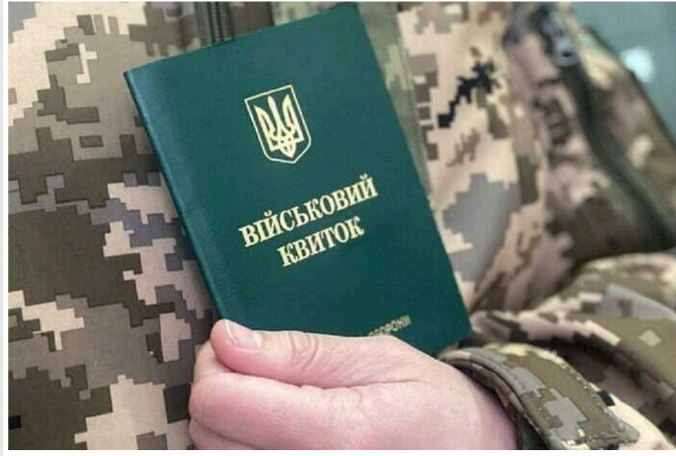
В Україні 950 тисяч чоловіків не працюють, не платять податки та не служать в армії, – ЗМІ

Це з 11,1 мільйона чоловіків, які підлягають мобілізації.