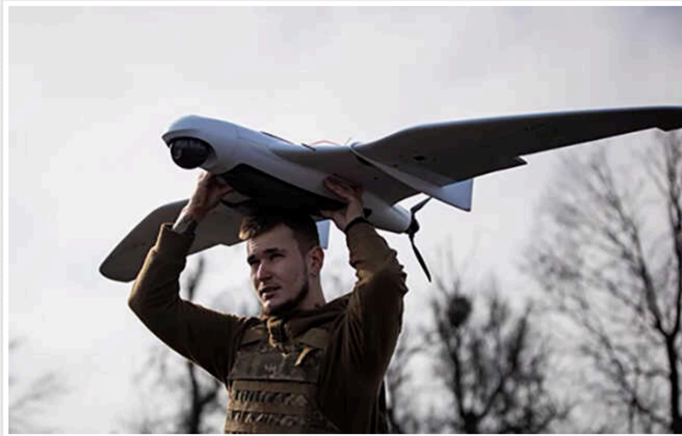
Forbes: Російські системи РЕБ не здатні впоратися з українськими БПЛА