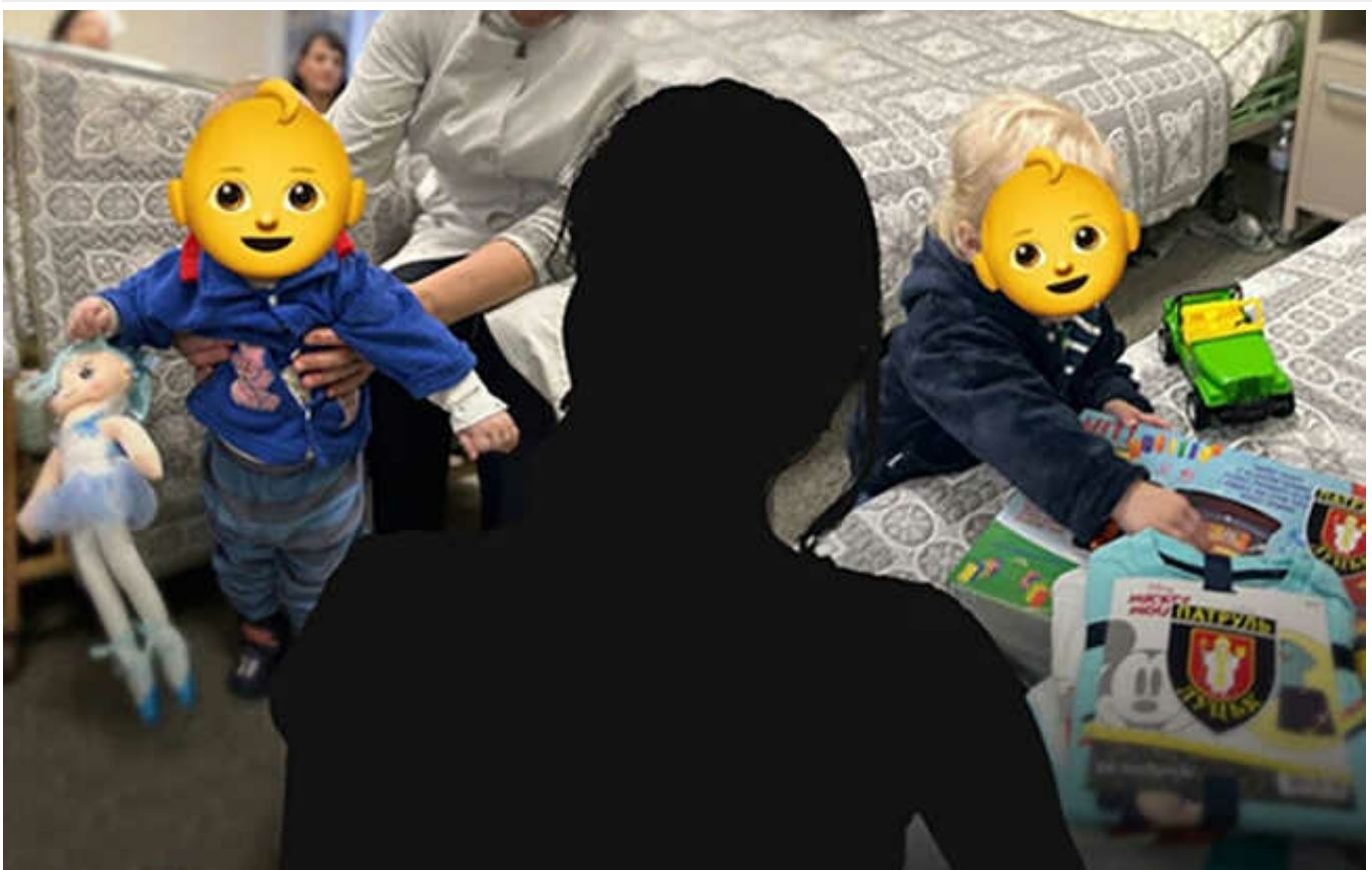
На Волині жінка покинула двох дітей, тому що поспішала до чоловіка

Поки що хлопчики поїдуть до притулку, а потім суд вирішуватиме їхню долю.