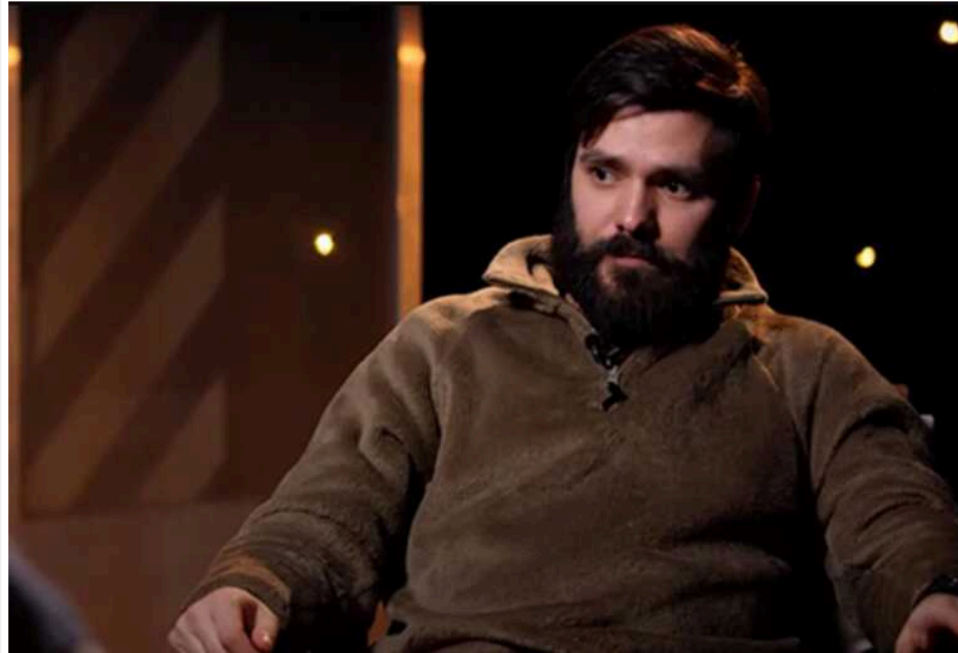
Військовий ЗСУ прокоментував "розбірки" Залужного, Сирського та Зеленського

Начальник штабу бригади НГУ "Азов" оцінив, до чого чвари довели Україну.