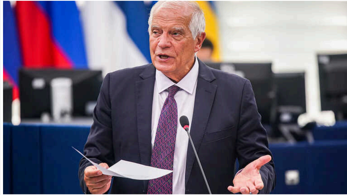
Якби ми менше вагалися в підтримці України, війна була б іншою, - Боррель

Глава дипломатії ЄС Жозеп Боррель заявив, що російсько-українська війна "була б іншою", якби Євросоюз не вагався у допомозі Україні.