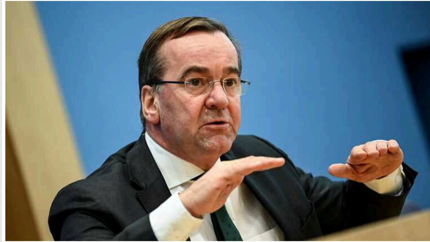
Пісторіус закликав Європу та НАТО готуватися до "найгіршого сценарію": Росія може напасти за 5-8 років

Міністр оборони Німеччини Борис Пісторіус, говорячи про можливість війни з Росією, закликав Європу та НАТО підготуватися до "найгіршого сценарію".