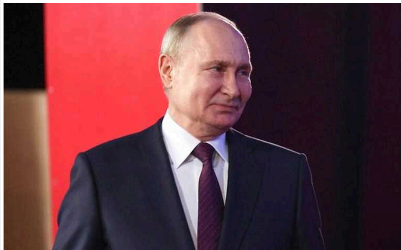
The Hill: Чому Путін каже, що «хоче переобрання Байдена»