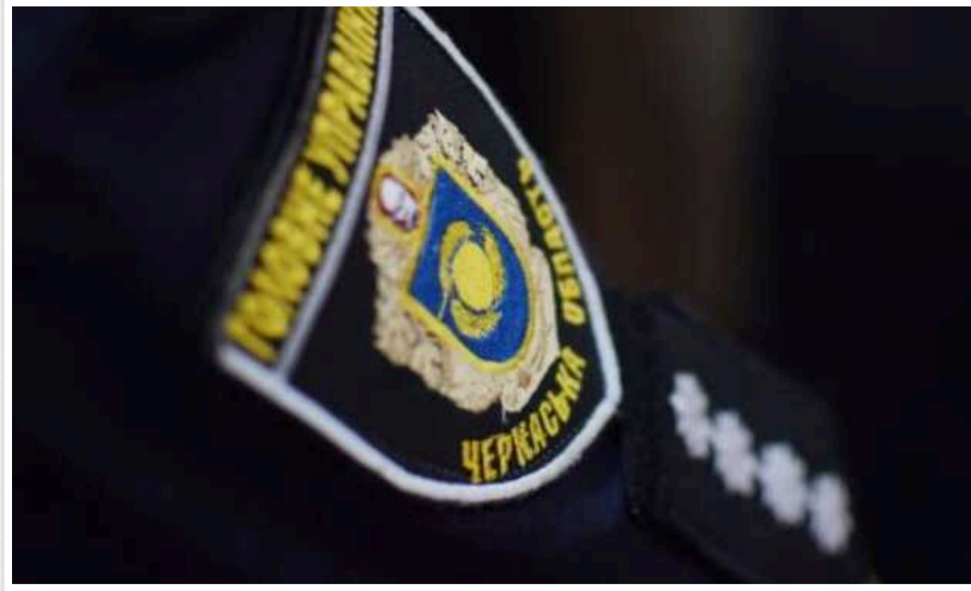
У Черкаській області сталося подвійне вбивство

У Черкаському районі в будинку знайшли тіла чоловіка та жінки. У вбивстві двох людей правоохоронці підозрюють 57-річного черкася. Наразі чоловік під вартою